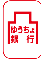
ゆうちょ銀行または郵便局にてお申込みください。