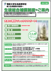
プランをお選びください。

同封いたしました払込用紙が加入依頼書になっています。必要事項をご記入のうえ、保険料を添えて、お近くのゆうちょ銀行または郵便局にてお振り込みください。(振込手続きをもってお申込みは完了します。) 加入者票については、2021年5月下旬以降順次郵送予定